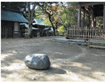
拝殿右手の境内にあります