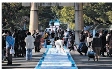
宮崎宮参道でのライブペインティング

10月～12月に区内の会場で行われる芸術文化に関するイベント。音楽、美術、演劇、舞踊、伝統芸能、文芸、漫画・アニメーション等のメディア芸術、書道・茶道・華道など、ジャンルは問いません。