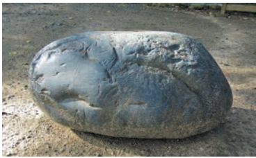
市指定有形民俗文化財 指定 (平成17年度)