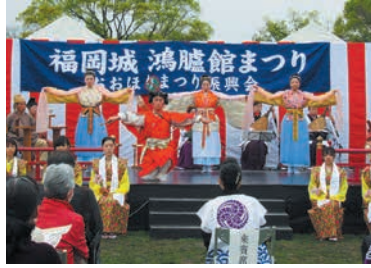
当時を再現した衣装で踊ります