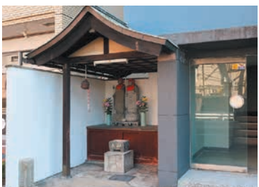
住宅街にひっそりと

かつて、平尾一丁目の新川橋そばの屋敷内に地蔵尊が祭られていました。屋敷がなくなると地蔵尊は野ざらしになりました。その後、ビルの一角にお堂が建てられ、2体の地蔵尊は現在の場所に移されました。