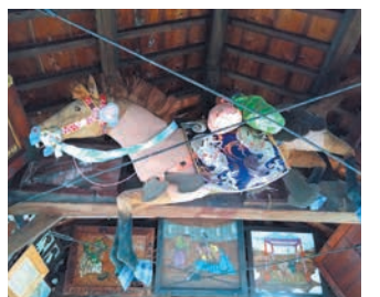
うま(馬)く受か(宇賀)るかも

福岡藩六代藩主・黒田継高公の時代に享保の大飢饉が起こりました。多くの人が飢えで亡くなり、牛馬も死滅するなど甚大な被害が出ました。大飢饉の後、継高公は五穀豊穡を祈り、宝暦10(1760)年に社殿を造営しました。明治時代に社名を現在の宇賀神社