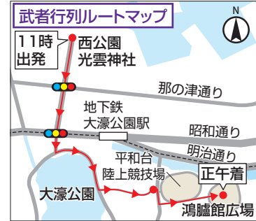
武者行列ルートマップ

昭和44(1969)年に西公園で万葉歌碑の除幕式が行われた時に「荒津まつり」が催され、現在の「福岡城・鴻臚館まつり」に発展しました。地域の人たちが、祭りへの参加を通して、故郷の良さに共感し、歴史や文化を次の世代に伝える