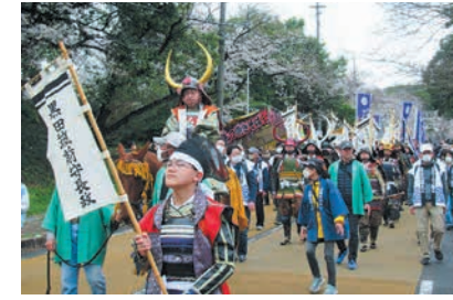
二十五騎武者行列 (前回)

大濠公園、舞鶴公園、西公園の一角は、飛鳥・奈良・平安時代に大陸との交流拠点として鴻臚館が置かれ、福岡藩の時代には福岡城が築城されるなど、歴史上重要な役割を担っていた場所です。