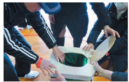
協力して段ボールトイレを組み立てます

参加者は手順を確認しながらテントや段ボールトイレなどを組み立て、非常持ち出し品の展示解説や心臓マッサージの方法、AED(自動体外式除細動器)の使い方を学びました。