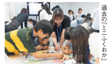
過去の「ミニふくおか」

8月22日(土)、23日(日)に市役所15階で「子どもがつくるまち ミニふくおか」を開催します。子どもたちが仮想のまちをつくり、仕事や遊び、人との関わりなどを通してさまざまな体験をするイベントです。①まちの仕組みを考え、当日はスタッフとして活動する「子ども実行委員」②その手助けをする「サポーター」を募集します。申し込み方法など詳細はホームページを確認を。【活動期間】5月〜9月(8回程度)【対象】市内に住むか通勤・通学する①小学5年〜中学生②高校生〜25歳【定員】①小学生20人、中学生20人②30人(いずれも抽選) ☎西日本新聞イベントサービス☎791-3372 電 es_mini fukuoka@nishinippon-np.jp