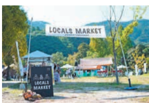
アブラヤマーケット

食品や雑貨などを販売。4月25日(土)は警察や陸上自衛隊の「はたらくるま」が集まります。26日(日)には福岡大学和太鼓部「鼓舞猿(こぶざる)」の特別公演あり。中学生以下は保護者同伴。☎4月25日(土)、26日(日)午前11時～午後4時 ☎牧場側 ☎入場無料 ☎不要