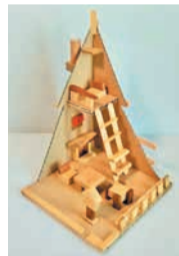
⑧ダンボールドールハウス作品例

一部講座は材料を持参。市内に住むか通勤・通学する人 ※⑧は小学生以上の子ども(2人まで)と保護者(計4人まで)、⑩は小学生と保護者のペア開①500円②7300円③～⑥⑧⑨⑩無料(③⑨は部品代別)⑪1組500円開①②④⑦⑧⑩⑪はがきで①4月22日②4月29日④5月4日⑦5月12日⑧5月13日⑩5月16日⑪5月20日(いずれも必着)までに問い合わせ先へ。ホームページでも受け付けます。当選者におのみ通知。③⑤⑥⑨電話か来所で、5月1日以降に問い合わせ先へ。