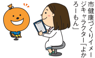
市健康づくりイメージキャラクター

月6日(水・休)午前8時30分～10時30分、12日(火)午後6時～7時⑫5月24日(日)午前10時～正午市内に住む人。①は市国民健康保険加入者②～⑩は職場等で受診機会のない人開先着順料一部減免あり☎電話かメール(☒ yoyaku@kenkou-support.jp)、来所で、2日前までに予約を。開3カ月～小学3年生(無料。希望日の4日前までに要予約)