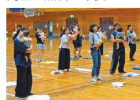
あかちゃんといっしょ(乳幼児の親子遊び)