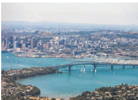
スタートアップ支援に力を入れるなど福岡市との類似点もあるオークランド市

オークランド市は、ニュージーランド全人口の約3分の1が集まるニュージーランド最大の都市です。日系企業を含む多くの企業が拠点を置く、経済の中心地でもあります。