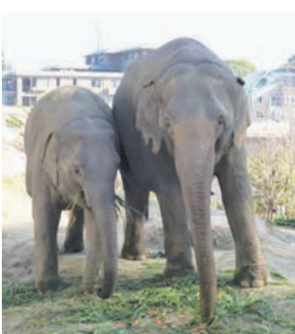
市動物園にやってきた雌の象の親子(ゆずはとわかば)

また、交流の一環として、2019年にヤンゴン動物園と動物交流に関する覚書を締結し、2024年7月には市動物園にアジアゾウがやってきました。