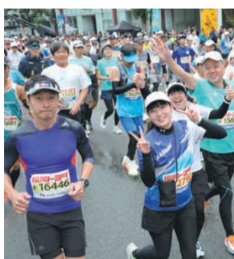
天神を元気にスタート(昨年)

4月20日(月)午前10時〜5月20日(水)午後8時までに、大会ホームページ(福岡マラソン)で検索から申し込みを。マラソン、ファンラン共に2〜10人でのグループエントリーが可能です(個人との重複は不可)。※「ふくおかスポーツ応援ランナー枠」は、7月24日(金)午後5時までに。