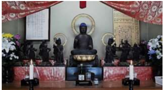
月光菩薩 薬師如来 日光菩薩 《 - 薬師三尊 - 》