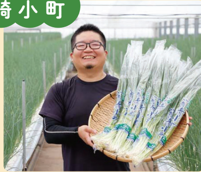
あお はごぎこまち 青ねぎ「箱崎小町」