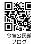
今宿公民館 ブログ