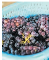
収穫したばかりのブドウ

ワイン作りは2012年の開園当初に始まり、例年、ボージョレ・ヌーボーの解禁日に合わせた11月中旬ごろに「かなたけの里わいん」として地元の酒店で販売されます。今年は、園内施設の「CO_YARD KANATAKE(こやど かなたけ)」でも購入できます。