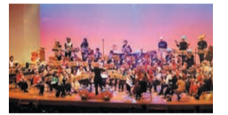
大人も子どもも楽しめます