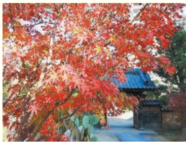
見頃を迎えた興徳寺の紅葉