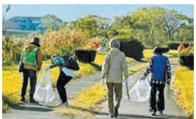
みんなで美しく清掃します