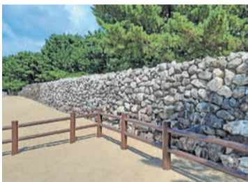
昨年8月の改修により、間近で見学できるようになった生の松原地区元寇防塁

この防塁のおかげで、元軍は2度目の侵攻(弘安の役)で博多に直接上陸できず、防塁のない志賀島から上陸し、そこで戦いが繰り広げられたと伝えられています。