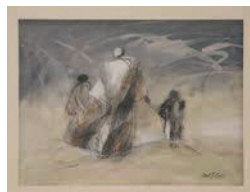
昨年度の区長賞 「風の中で」

いずれも15歳以上(中学生は除く) 申区役所や各公民館などで配布する申込書(区ホームページからダウンロード可)に必要事項を書いて、10月31日(月)必着で、西区イベント推進会議事務局(〒819-8501住所不要、区企画振興課内) ☎895-7033 ファ885-0467 電shin ko.NWO@city.fukuoka.lg.jp)へ郵送、ファクス、メールまたは持参。※作品は12月11日(日)に西市民センター3階実習室へ搬入要。