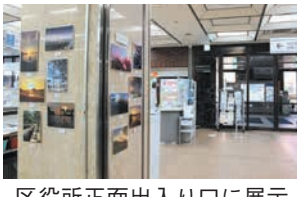
区役所正面出入り口に展示しています