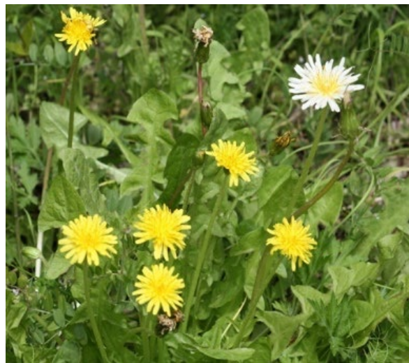
今山で見ることができる珍しいタンポポ

今山は今津湾の西側に位置する高さが約80mの山で、その山頂及び山麓一帯が保全地区となっています。山頂近くに熊野神社があり、その周辺にスダジイやイチョウ、エノキ等の保存樹が多数あります。また、日本の在来種の「カンサイタンポポ」と「シロバナタンポポ」が一緒に群生している数少ない場所でもあります。