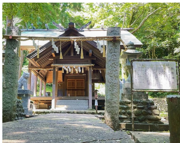
今山の山頂付近にある熊野神社

Mt. Imayama is about 80 meters high located west of Imazu Bay, with its summit and base designated as a conservation area. Near the summit stands Kumano Shrine which is surrounded by numerous preserved trees, including Japanese chinquapin, ginkgo, and Japanese hackberry. This area is also one of the few places where Japanese native species, Kansai dandelion and white-flowering Japanese dandelion, coexist in clusters.