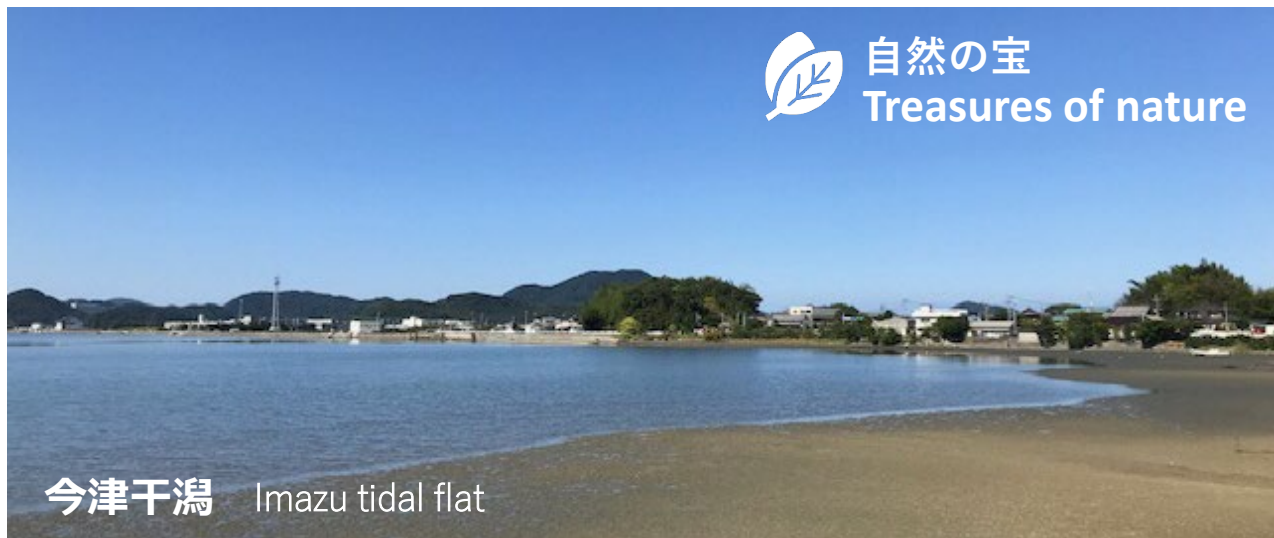
今津干潟 Imazu tidal flat