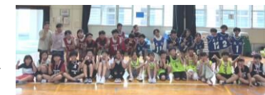
子ども会育成連合会

6月14日(日)、校区ドッジボール大会を行いました。 5・6年生の男女4チーム総当たり戦で行い、暑さに負けず楽しみながら白熱した戦いが繰り広げられました。