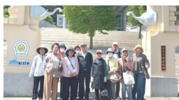
健康・献血推進連合会

5月14日(木)、11名の地域住民の方々と動植物園に行ってきました。 公共交通機関を乗り合わせ、お話ししながらのお散歩は楽しく、そよ風が気持ちよくてお弁当がより一層美味しく感じられました。健康・献血推進連合会では、このようなイベントや講座も予定しております。ぜひご参加ください。