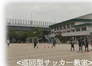
<巡回型サッカー教室>

アビス福岡のスクールコーチから ご指導いただき、小学生33名が 楽しく参加しました。