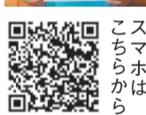
スマホはこちらから