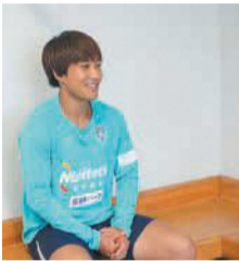
笑顔で子どもたちへメッセージを送る

周りの人への感謝を忘れないことが大切です。これからどんな困難があっても、支えてくれる人がきっといます。応援や支えを力に変えて、大事な人たちへ恩返しができるように頑張りましょう！