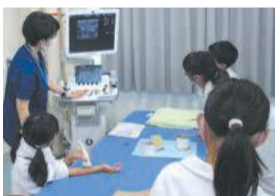
お医者さん体験(昨年度)

小学生に、学ぶ楽しさを発見してもらおうと、各大学と区役所が合同で7～9月に23講座を実施します。親子で参加できる講座も