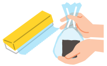
おにぎりはラップや型を使う