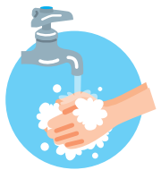
こまめに手を洗う

食中毒に注意してお弁当を作るポイントを紹介します。作った後は、涼しく直射日光を避けられる場所で保管しましょう。