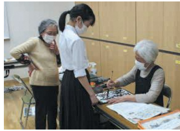
手本は講師が手書きで作成

今年もきれいな桜が桜原桜公園を彩っているぞう！ 区の広報担当キャラクター「ため蔵」くん