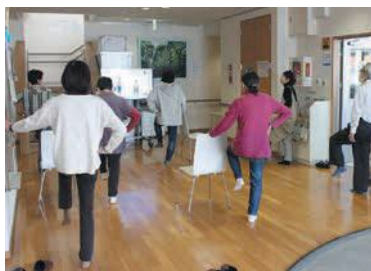
足腰を鍛えることで転倒を予防

参加者は「よかトレを通じて知り合いが増えました。みんなで体を動かすことで気持ちも明るくなっています」。