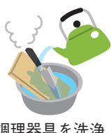
調理器具を洗浄・消毒する