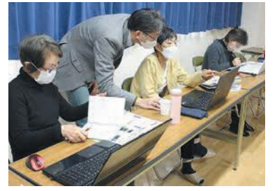
一人一人に親身になって講師が指導

第1・3月曜日に活動している「パソコンクラブ」では、主に高齢者の皆さんがさまざまなソフトの使い方やプログラムの作り方を学んでいます。受講者は「友達に送る年賀状を自作できるよう