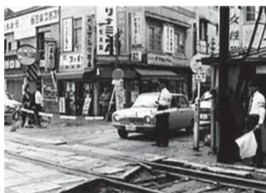
初代大橋駅付近の踏み切り(1975年ごろ)

うちよつと那珂川寄りに建つとったもんね。車窓からは高宮まで広がる田んぼを見ることができ