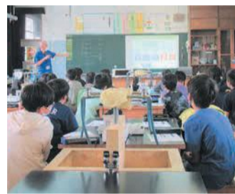
日頃の生活とエコの関係を学習

9月28日には、パナソニック株式会社から講師を迎え、筑紫丘小学校5年生を対象に「エコと太陽光発電」をテーマにした授業が行われました。受講を希望する地域や学校は、お気軽に相談を。 [問い合わせ先] 区生活環境課 ☎559・5101 ㊟561・5360