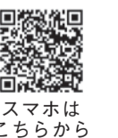
スマホはこちらから