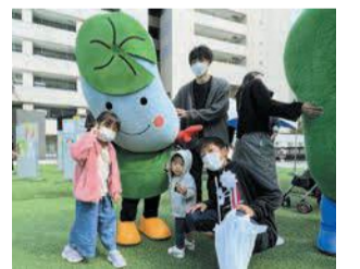
10月には「ふくおかカイゴつながるプロジェクト2022」に参加

区は、広報担当キャラクターため蔵くんの「着ぐるみ」を貸し出しています。老若男女に人気のキャラクターを、地域のイベントなどにご活用ください。 10月には「ふくおかカイゴつながるプロジェクト2022」に参加 区企画振興課 ☎559-5017 ㊟562-3824 料無料 ㊟使用開始日の3カ月前から区ホームページ「ため蔵 着ぐるみ使用」で検索)でお申し込みください。