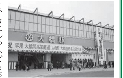
1978年移転当時の東口

移転し、利用客や発着する電車が増加した大橋駅は、南区の発展を象徴する施設の一つといえるでしょう。