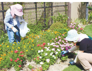
きれいな花を咲かせるため丁寧に手入れをします

宮竹校区の公園愛護会「花はなクラブ」は、井尻1号公園(井尻三丁目)で、毎日水やりや花のせん定を行う他、周囲の清掃活動などを行っています。同公園の花壇は、10種類以上の花を植えて色鮮やかにするように工夫されています。9月4日の活動では、4人で約2時間かけてマリーゴールドの活動です。皆さんにはきれいな花壇を眺めながら会話に花を咲かせてほしいです」と話しました。