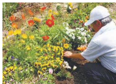
日々の手入れで花も元気いっぱい

5月15日の活動では、マリーゴールドやサルビアなど4種類の花を植えました。同公園の花壇です。公園を訪れた人にも、花壇の花を見て晴れやかな気持ちになっただけです」と話しました。