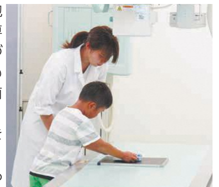
レントゲンの仕組みを学びます(こども大学)