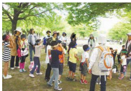
環境学習活動として実施された「自然観察会」 561-5360

ごみ減量・リサイクル、環境学習、環境美化などの自主的な環境活動を始めて3年以内の市民団体やNPO法人などを支援します。申請は7月31日(火)まで受け付けています。詳しくはお問い合わせください。