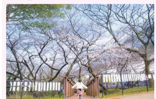
前回のグランプリ作品

図桜原桜賞実行委員会事務局(区企画振興課内) ☎559-5064 図562-3824