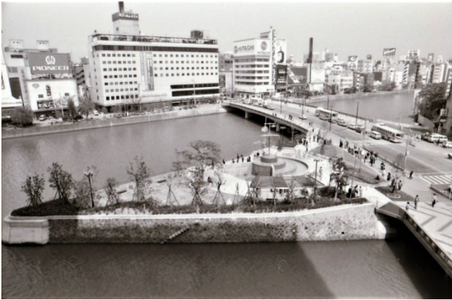
水上公園(福岡市中央区)