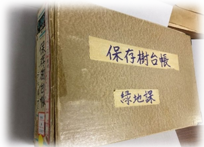
保存樹台帳【S50（1975）完結文書】