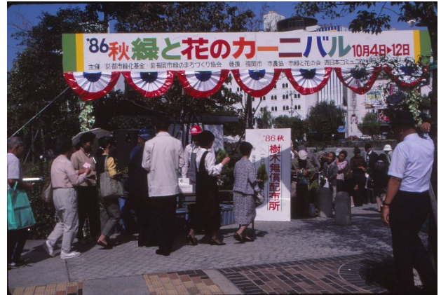
86緑と花のカーニバル(水上公園)