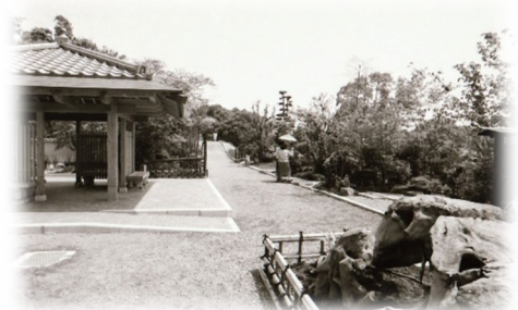
庭園（福岡市植物園）