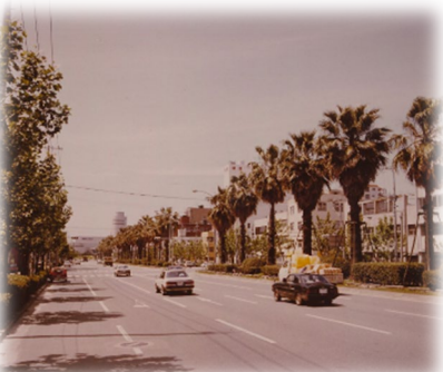
ワシントンiapーム（博多区・大博通り）