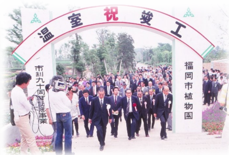
温室竣工（福岡市植物園）