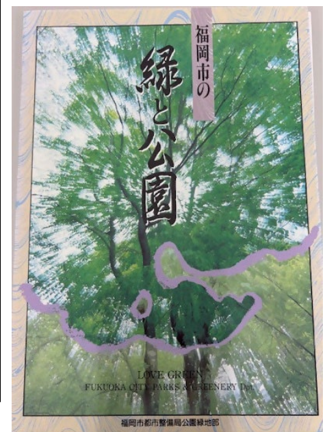
福岡市の緑と公園 【H6(1994)行政資料】