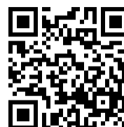
面談申込フォーム