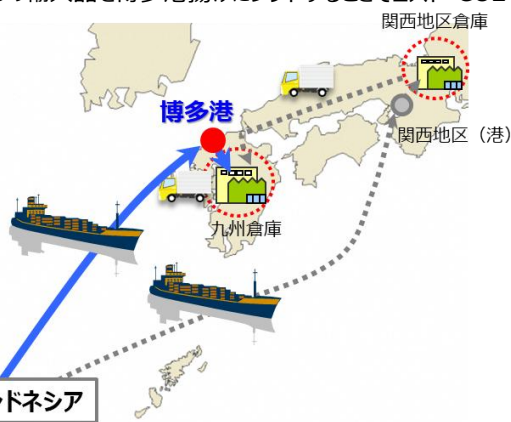
輸送コストの比較 (従前を100とする)