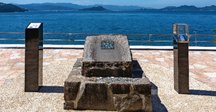
写真：金印公園から望む博多湾