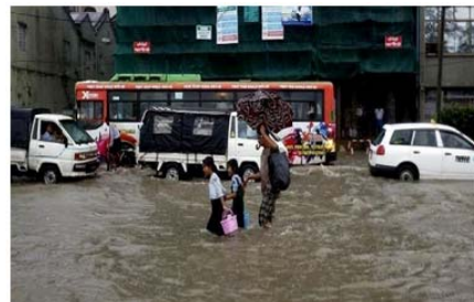
ヤンゴン市街地の浸水状況