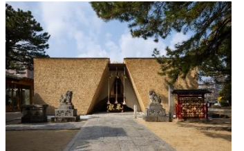
第30回都市景観賞大賞 鳥飼八幡宮 式年遷宮

福岡のまちの魅力を創りだしている建物や通り、企画や活動に関係している人たちの努力を讃え、広く市民に伝える事を目的に、昭和62年に「福岡市都市景観賞」を創設。これまでに229作品を表彰している。