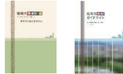
デザインガイドライン 色彩ガイドライン

届出にかかる行為の制限等を解説したデザインガイドラインや、色彩に関する目標基準である色彩ガイドラインを策定し、景観誘導を行っている。