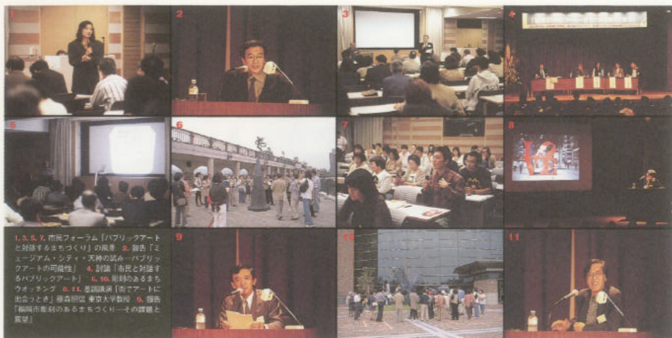
1, 3, 5, 7, 市民フォーラム「パブリックアートと対話するまちづくり」の風景。2, 報告「ミュージアム・シティ・天神の試み—パブリックアートの可能性」。4, 討論「市民と対話するパブリックアート」。6, 10, 彫刻のあるまちウオッチング。8, 11, 基調講演「都市アートに出会うとき」藤森照信 東京大学教授。9, 報告「福岡市彫刻のあるまちづくり—その課題と展望」。

また今回新たに、市民が気軽に参加できる無料の企画として、「彫刻のあるまちウオッチング&市民フォーラム」が併催された。まちの彫刻について感じることや彫刻のあるまちづくりの在り方、市民参加の方法などについて、熱心な意見交換がおこなわれた。告知不足もあり多くの市民が参加したとはいえないが、熱意ある市民の議論はこのような場の重要性をあらため