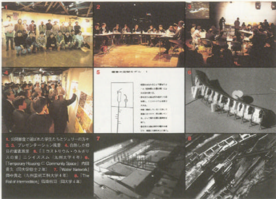
1. 公開審査で選ばれた学生たちとジュリーの方々 2, 3. プレゼンテーション風景 4. 白熱した初日の審査風景 5. 「ミコストリウム・ウルガリスの家」ニシイススム（九州大学4年） 6. 「Temporary Housing in Community Space」内田貴久（岡山大学修士2年） 7. 「Water Network」田中真之（九州芸術工科大学4年） 8. 「The Role of Intermediary」岡本裕司（同大学4年）

学で建築教育をおこなう者、実社会での建築関係者などが中心になって実現した自主的なイベントである。その背景には今日の大学建築教育に対する大きな危機感がある。これまで日本の多くの大学では技術者教育に重きが置かれ、建築や都市計画をおこなう際に重要なデザイン感覚、生活感覚、いわゆるソフト力がおろそかにされてきた。そのため、すでに大学教育より現実社会の方が数段先を行っているともいえる。加えて建築教育をおこなう大学自体が少ない地方では、大学相互の交流も少なく、限られた教官・学生での活動に終始しがちだ。