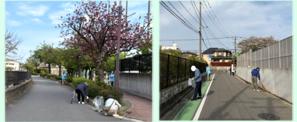
4月12日の活動の様子

6月14日(日) 8:15~ ※雨天中止 城南公民館集合。飲み物は各自ご持参ください。