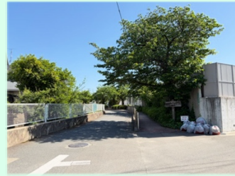
5月10日 作業終了後 きれいになりました