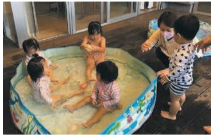
仲良くプール遊びをしました

多胎児サークル そらまめくらぶは市内でも数少ない、双子以上の多胎児と保護者を対象にした育児サークルです。南片江公民館を拠点に毎月第2土曜日に活動しています。