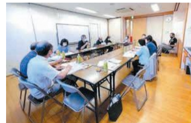
会議で見守り活動について話し合う委員

各町内の見守り担当委員は、自宅を訪問し、一人暮らしで困っていることや、子育ての不安や悩みを聞いたたり、高齢者には必要に応じて、高齢者の総合相談窓口「いきいきセンター」などにつないだりしています。また、町内ごとに見守り対象者の情報を共有し、災害時に在宅避難している人の安否確認の声掛けや、体が不自由な人との避難の仕方などを検討しています。