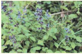
ヤマハッカ市民の森(油山)