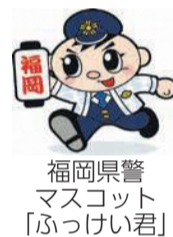
福岡県警 マスコット 「ぶっけい君」

は男性も被害に遭っています。次のことを心掛け、被害を防ぎましょう。 ▽バッグは車道と反対側の手に持つ▽ショルダーバッグは斜め掛けにする▽できるだけ人通りの多い道を通る▽自転車の前かごに防犯ネットを付ける