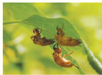
セミの抜け殻(油山市民の森)

城南区役所 〒814-0192城南区鳥飼六丁目1-1 代表電話 ☎822-2131 ☎822-2142