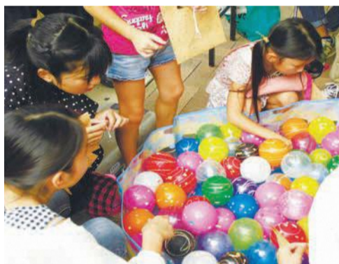
子どもに好評のヨーヨー釣り

七隈校区では、小・中学生が主体となって企画・運営するお祭りを開催します。梅林中学校吹奏楽部のファンファーレで始まり、ヨーヨー釣りやお化け屋敷の他、かき氷などの販売を行います。☎8月19日(土)、午前10時半～午後1時半☎七隈公民館 ☎871-6905 ☎871-5247