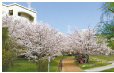
西の堤池に咲く桜(例年4月上旬)

城南区役所 〒814-0192城南区鳥飼六丁目1-1 代表電話 ☎822-2131 ☎822-2142