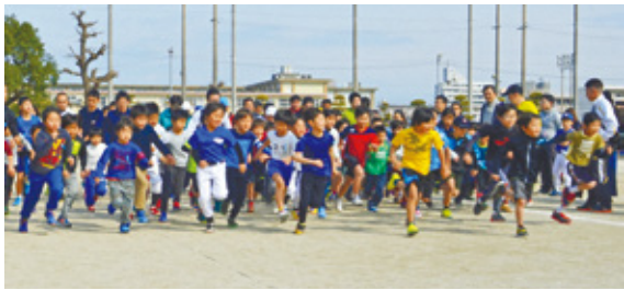
小学生が勢い良くスタートした子どもマラソン

校区のイベントや活動の情報は、各校区ごとに作成している公民館だより(または自治協だより)で知ることができます。公民館だよりは毎月1回発行され、住んでいる校区ごとに各家庭に回覧される他、各公民館や区役所・市民センター・区ホームページ(「城南区 地域・公民館」で検索)で閲覧できます。また、一部の校区では独自にブログで、地域のイベント情報などを随時発信していますので、区ホームページからご確認ください。