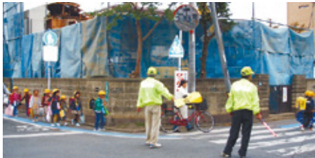
「ちょこパト」以外にも毎週水曜日は小学生の下校に合わせ、通学路を見守ります