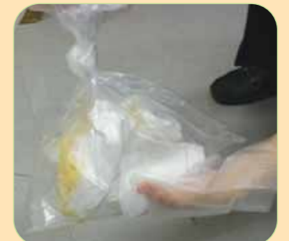
③ビニール袋はしっかり口を締めて廃棄する