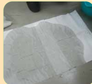
④汚物が付着していた床やその周囲は0.1%次亜塩素酸ナトリウムを染みこませたペーパータオルで覆うか、浸すように拭く