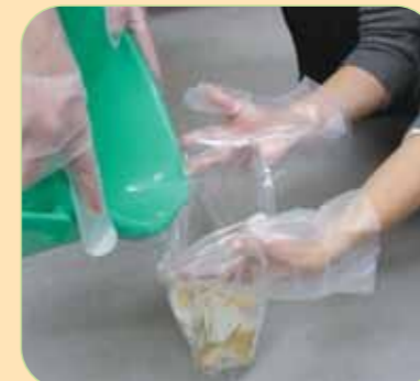
②使用したペーパータオルはすぐにビニール袋に入れ、0.1%次亜塩素酸ナトリウムをペーパータオルに染みこむ程度に入れる