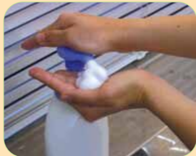
③手洗い石けんをつけます