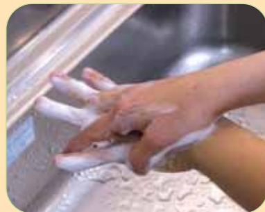
⑤手の甲、指の間をこすります