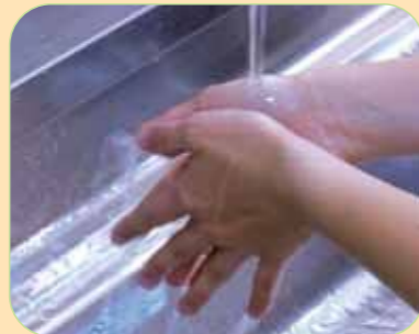
②水で手を濡らします