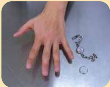
①時計や指輪をはずします