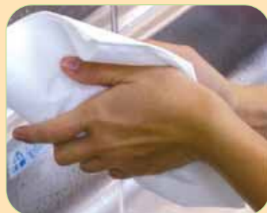
⑪ペーパータオルで拭きます