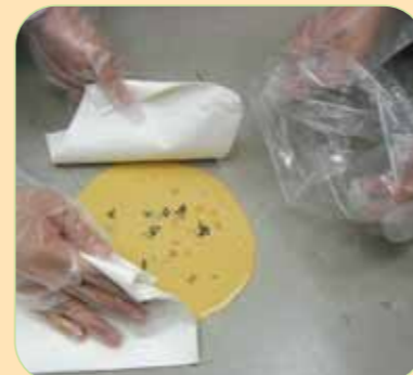
①使い捨てのペーパータオルなどで汚物の外側から内側に向かって静かに拭き取る