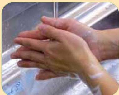
⑩水で十分洗います