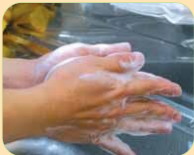
④手のひらをよくこすります