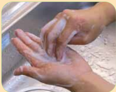
⑦指先をこすります