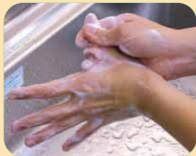
⑥親指を念入りに洗います