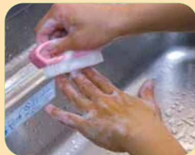
⑧爪ブラシで指先を洗います