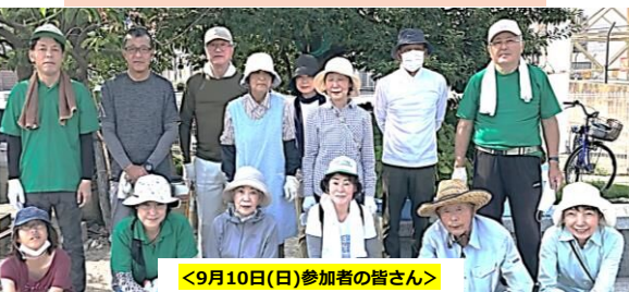
<9月10日(日)参加者の皆さん>