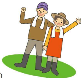
（みわだいファーム・トマトの会）

お問い合わせ先：みわだいファーム・トマトの会（TEL 092-607-0294 美和台公民館内）