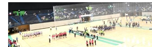
【主催：子ども会育成連合会】

香椎校区からは、東区大会で優勝した女子チームが参加し準優勝でした。低学年が多いなか、子どもたちは一所懸命にがんばりました。