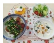
【主催：食生活改善推進員協議会】