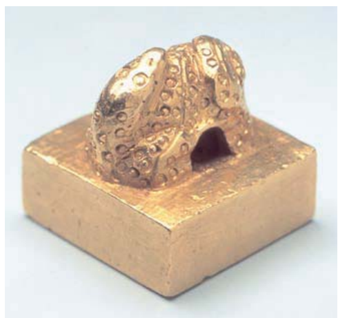
金印 福岡市博物館所蔵

書かれています。また、別の中国の歴史書には、この時の使者が「自分は太伯の子孫である」と語ったと書かれており、江南にあった『呉』という国を作った太伯の子孫であれば、奴国からの使者は江南からの渡来人の子孫ということになります。この他、中国の歴史書には、九州北部の人が鯨面文身をしていることや、貫頭衣を着ていることなど、江南地方と似た習俗を持っていると書かれていて、「あづみ族は、江南から渡来してきた」という説の根拠となっています。