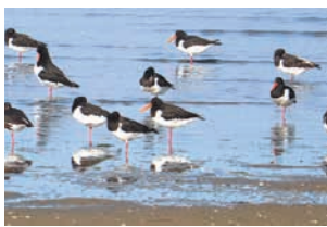
赤いくちばしのミヤコドリ

よって多種多様な野鳥を見ることができ、特に冬はミヤコドリやツクシガモなどを観察できます。