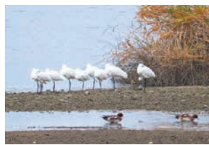
クロツラヘラサギ