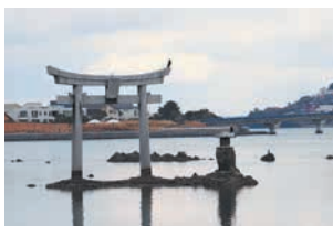
海上の鳥居に止まる鳥