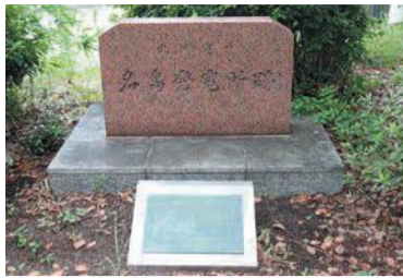
名島火力発電所跡の碑

大正9(1920)年、東洋一と呼ばれた名島火力発電所が稼働を始めた。火力発電所の候補地が検討される中、名島に決まった理由は、西戸崎、姪浜炭鉱に近く、燃料である石炭を鉄道や船舶で運ぶのに便利な場所であったからといわれています。当時は、高さ61メートルの大煙突4本か