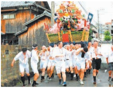
山笠が町内を勢いよく走ります

歴史 唐原にある須賀神社は、香椎宮が創建された724年以前から唐原地区の氏神として祭られています。地元では「祇園宮」の名で親しまれています。 須賀神社の最大の行事である「祇園山笠」は、令和元年に「福岡市指定無形民俗文化財」に指定されました。 山笠は7月1日の「注連下ろし」から始まり、山笠の道具類を取り出す「台おろし」、基礎部分を組み立てる「台からげ」、祭礼前日に人形などを飾り付ける「山飾り」を経て、14日の祭礼当日朝に香椎宮神官による神事が行われます。 夕方、子どもたちが掛け声とともに、触れ太鼓を鳴らして山笠が動くのを待ちます。 唐原の山笠行事は、地域住民によって全て行われます。若い世代へ伝統を受け継いでいく一体感の感じられる伝統の行事です。