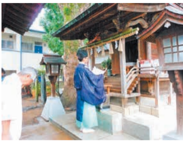
香椎宮司による神事