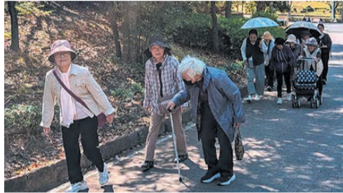
東平尾サロンでは公園散策などを通じて交流を深めています

5月12日から18日の『民生委員・児童委員の日』活動強化週間にあわせて、小学校の登校の見守りも行いますので、見かけたらぜひ声をかけてください」と話します。