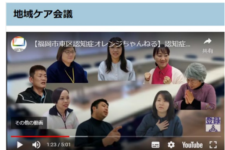
認知症ライフサポートワーカーが作成した動画を掲載