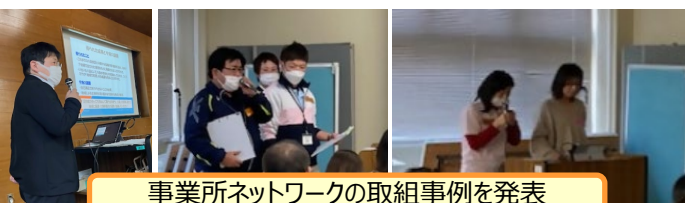
事業所ネットワークの取組事例を発表