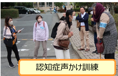
認知症声かけ訓練