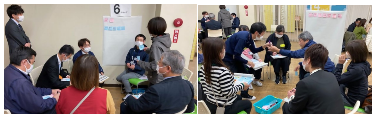
「事業所NWの活動での困り事、取り組んで良かった事等をみんなで共有しよう」をテーマに、意見交換