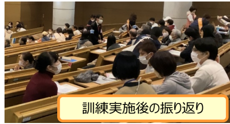
訓練実施後の振り返り