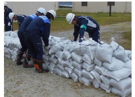
土のう積みの様子