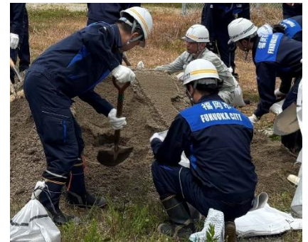
土のう製作の様子