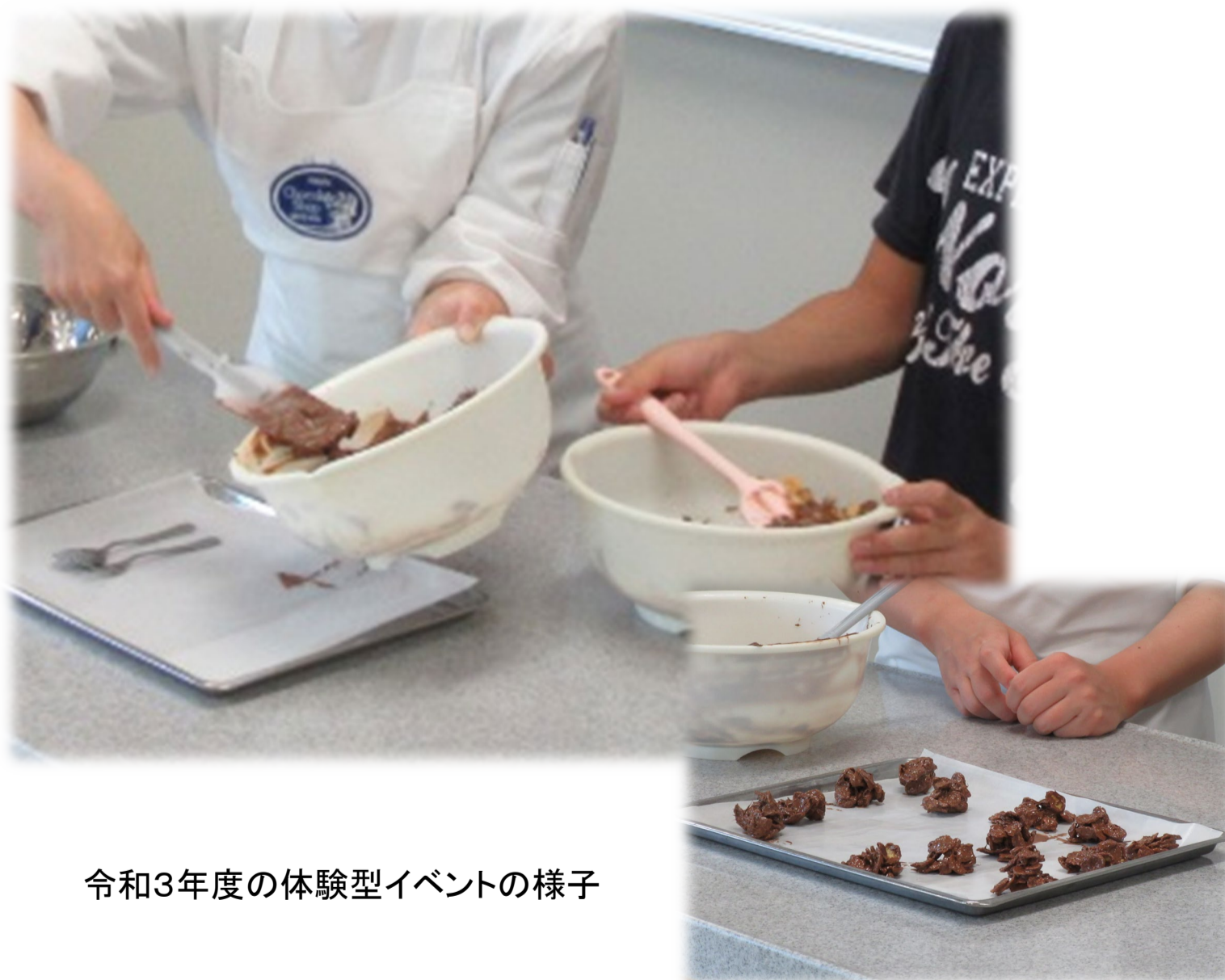
令和3年度の体験型イベントの様子