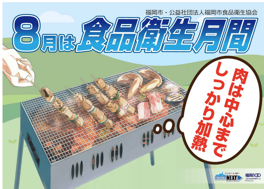
令和4年度「食品衛生月間」ポスター