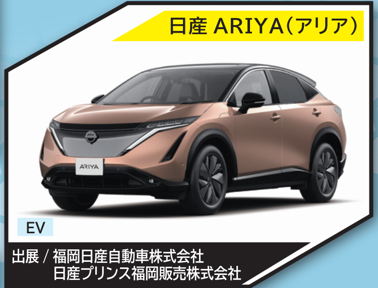
日産 ARIYA (アリア)