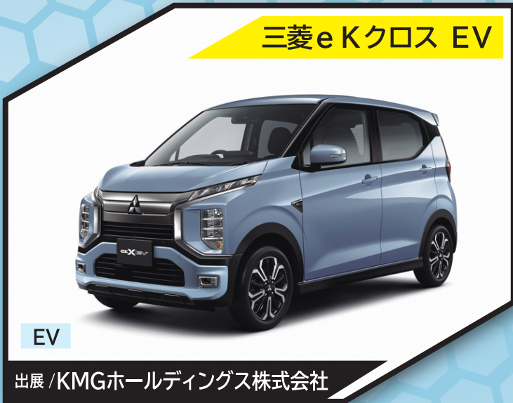
三菱 eKクロス EV