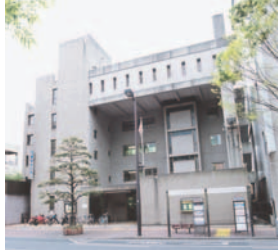
青年センターは明治通り沿いにあります

大名! 20代! シャベリ場!! 【シャベリびと募集】対象は20代。無料。当日、来所で同センターへ申込みを【見学者】先着30人。無料。申込み不要。開7月5日(土)午後3時~5時