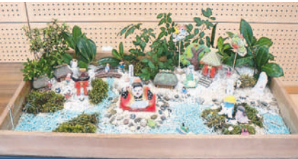
昨年作った「いけどうろう」

「いけどうろう」であそびましょう 土人形を作り、箱庭に飾ります。小学生は保護者同伴。開7月26日(土)、8月2日(土)午後1時半~3時半、10日(日)午後3時~4時(全3回) 定15組 料無料 託電話かはがき、ファクスに応募事項と性別を書いて7月15日(必着)までに同館へ。