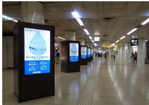
令和3年度の様子(デジタルサイネージ)