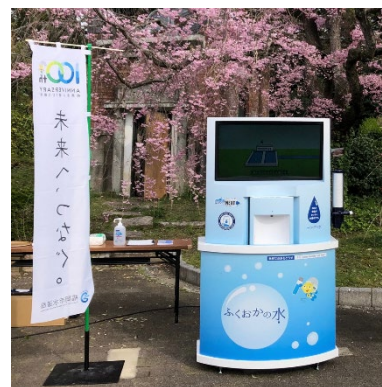
デジタルサイネージ付き 給水スポット