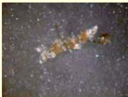
写真1 ギョウザの皮の小麦ふすま

しかし、多くの黒い斑点の原因は確認できなかったので、25℃、48時間培養し観察した結果、苦情品には一面にカビの生育が認められました(写真2)。